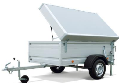
Tiefelader mit Deckel, Modell DB