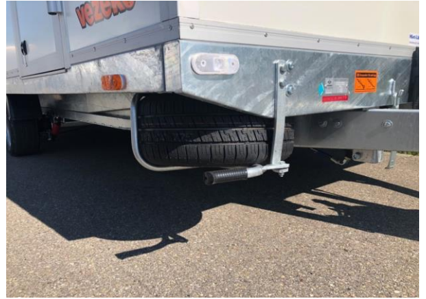
Ersatzrad mit Halter unter Brücke (Mehrpreis)