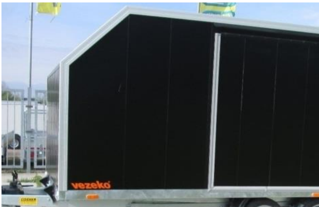
Aussenfarbe schwarz (Mehrpreis)