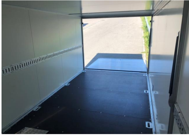
2 x 5 Bindebügel am Boden