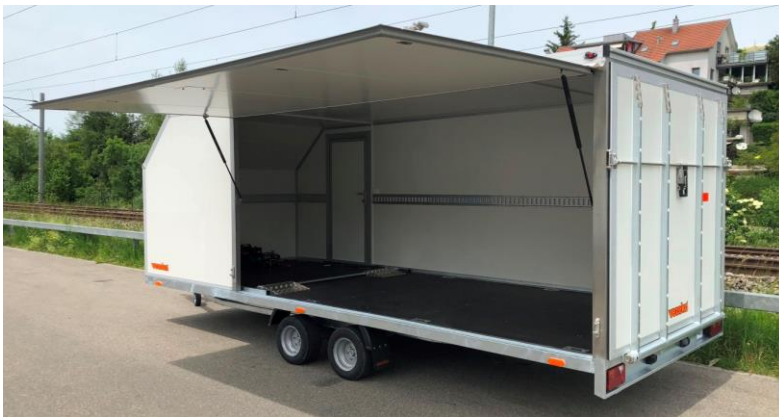
Seitenklappe mit Stangenverschluss