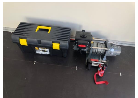
Elektro-Seilwinde am Boden montiert