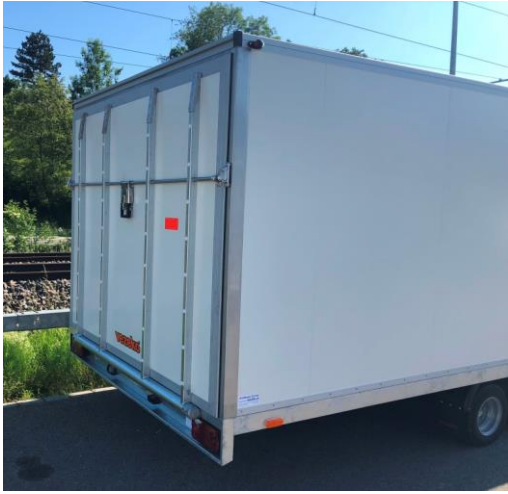
Heckrampe mit Stangenverschluss