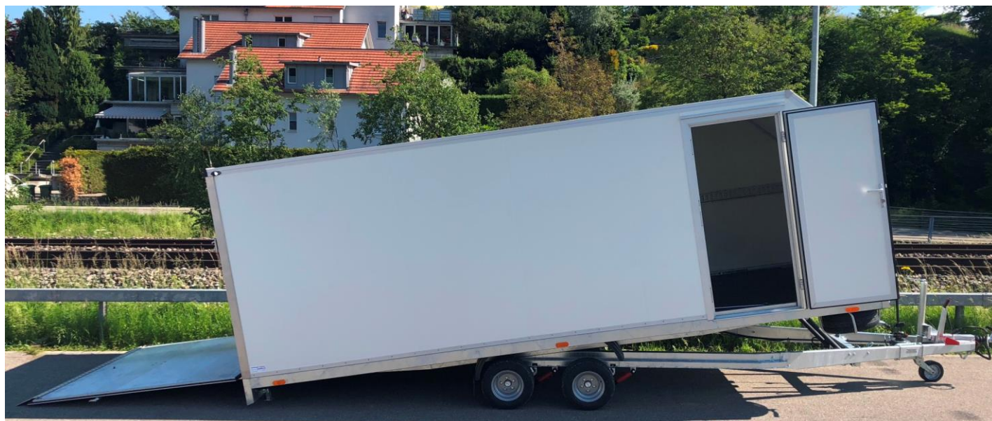
Formula 30.55 550 x 212 x 180cm, Seitentüre (Mehrpreis)