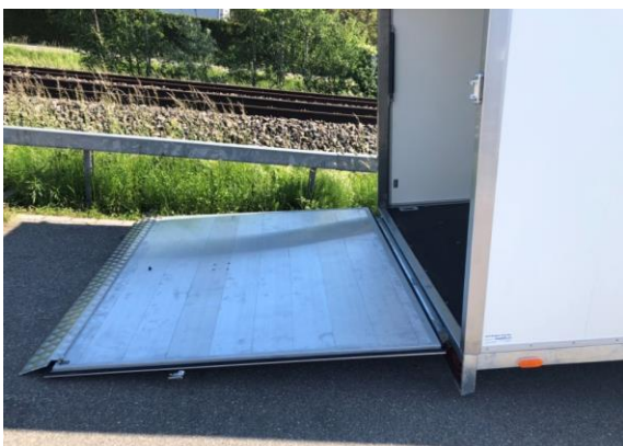
Rampe mit Überfahrblech am Rampenende Änderungen vorbehalten Miet-Lift Reinle AG, 052 203 33 11