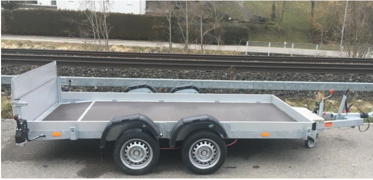
Boden hinten angeschrägt, 60cm Aluminiumrampe 1000kg belastbar, Boden verstärkt für Beladung von Kleinstapler