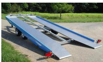
Touring, 4 Radstossdämpfer (km/h 100), 4 Radgurte