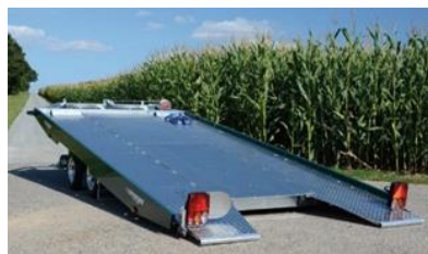
Typ KHL Boden geschlossen mit Aluriffelblech