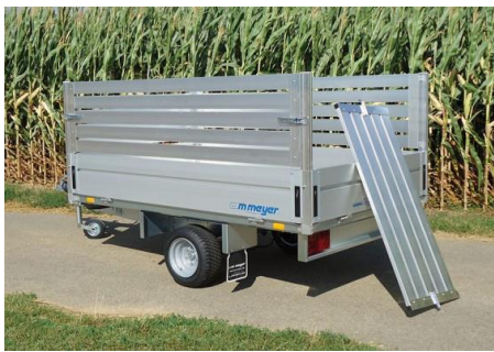
seitlich nicht zum ausklappen